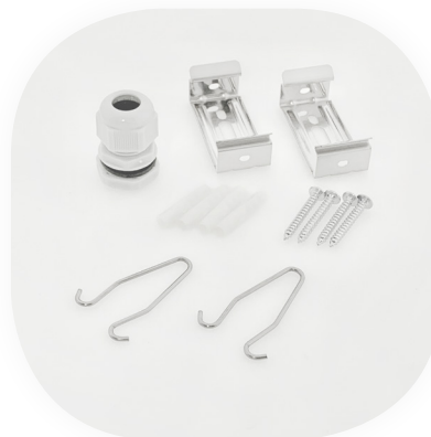
Zubehör von Feuchtraumleuchte Serie LMF

*Die Seile und Ketten für Hängend-Montage sind nicht im Lieferumfang enthalten.