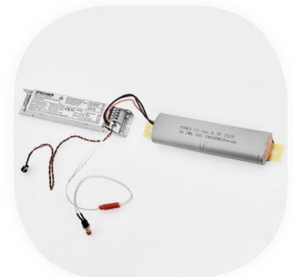
3 Stunden Laufzeit Mit Steuerung